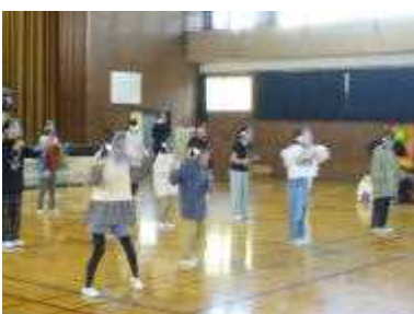
<5年生 お面をかぶってダンス>