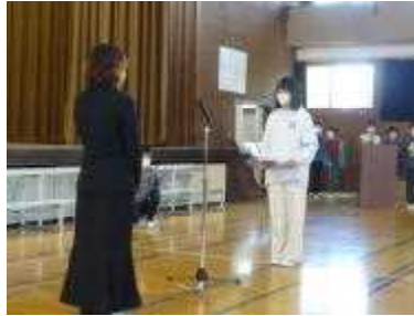
<PTAから卒業記念品贈呈>