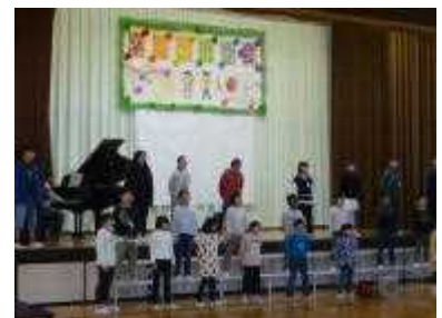
<4年生 合唱スバルアゲイン>