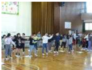
<3年生 ジャンボリーミッキー>