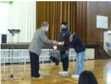
<同窓会入会・記念品贈呈>