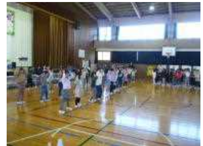
<1年生 チェッチェッコリ>