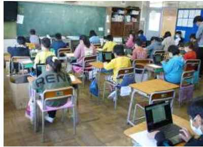
<4年 タブレットを使ってみる>