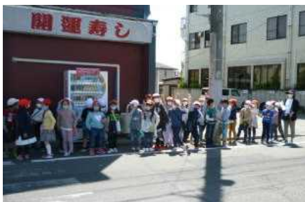
<2年 春のまちを歩こう>