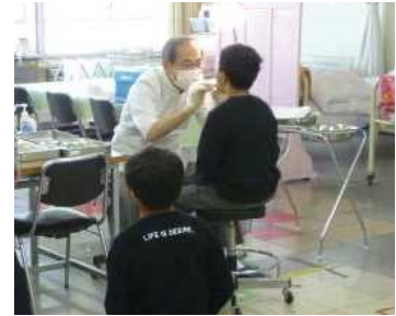
<6年 よい歯の子 校内審査>